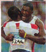
„Sind das Sprinter oder Bodybuilder?“: Sprint-Legende Armin Hary hat angesichts der Muskelberge von Gatlin und Crawford (Foto links) und Nesterenko (r.) Zweifel an der Sauberkeit des Sprints.

Schön? Das waren die doofsten Ausreden! Plötzlich kann man das Wasser nicht spüren, der Wind hat einen gestreift, die Wellen waren hart. Oder Ingo Schultz! Wenn ich den acht Tage vor Olympia höre, wie er, nachdem er eine schwache Zeit gelaufen ist, sagt,