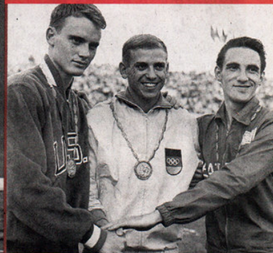
So strahlt ein Olympiasieger: Armin Hary (M.) mit dem Ami Sime (l.), der Silber holte, und dem Briten Radford (Bronze)